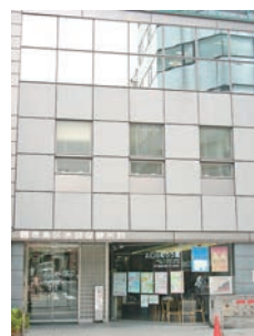
豊島区口腔保健センター あぜりあ歯科診療所